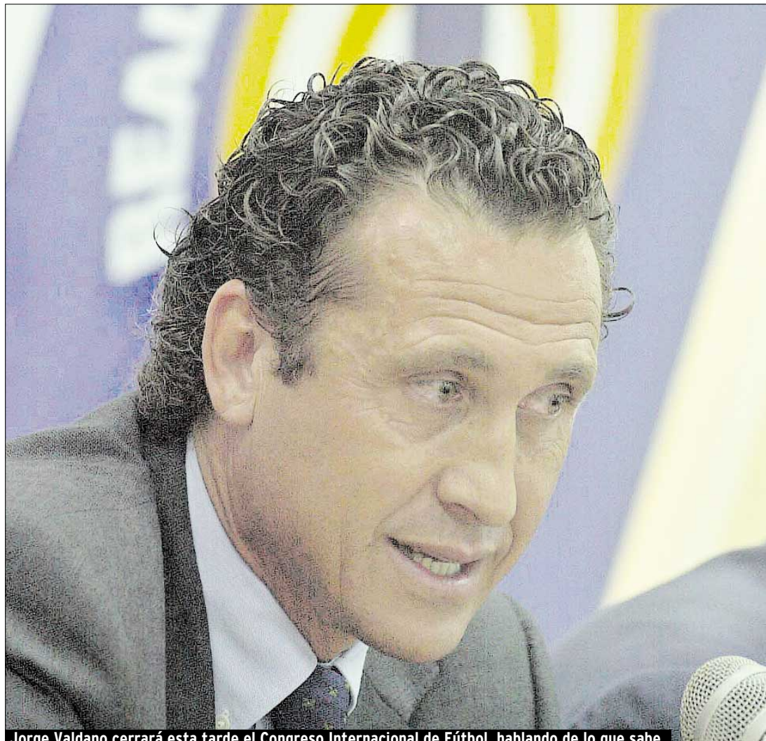
Jorge Valdano cerrará esta tarde el Congreso Internacional de Fútbol, hablando de lo que sabe.

Del cordobés Baldassi puede decirse que es uno de los más respetados árbitros internacionales del fútbol argentino, al punto que en abril pasado participó de un curso de capacitación organizado por la Fifa tras ser designado por el Colegio de Árbitros de la AFA. Se considera que será el sucesor de Elizondo en el próximo Mundial de Sudáfrica 2010. El turno de los dos árbitros se abre a partir de las 15.30.