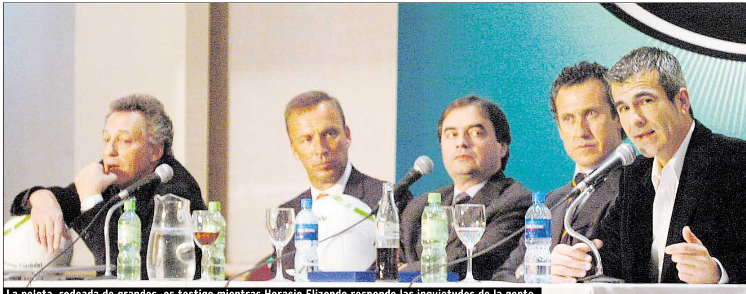
La pelota, rodeada de grandes, es testigo mientras Horacio Elizondo responde las inquietudes de la gente.

Valdano volvió de ese concepto para explicar que el fútbol ha experimentado algunos cambios que ponen en duda las verdades absolutas. Y utilizó la experiencia del Real Madrid, como director deportivo. "Manejar el cambio" fue la consigna que desarrolló quien ahora desempeña