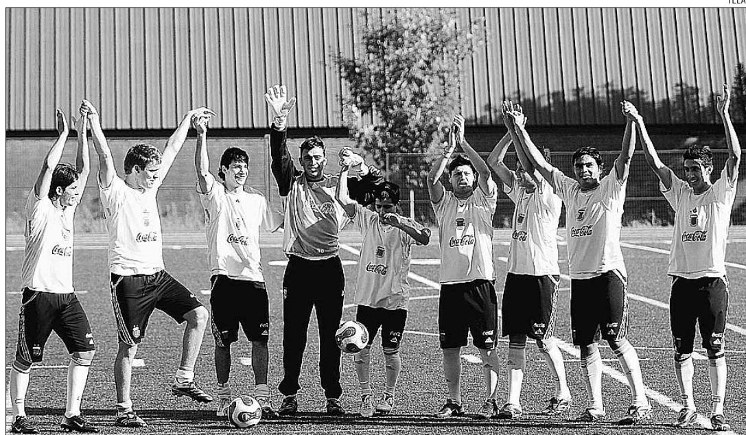
Los juveniles de Argentina son puro optimismo. Esta noche, en Ottawa, se juegan el pase a las semifinales.

La única duda está en el ataque: se espera por estas horas la evolución de Mauro Zárate, que padece una sinovitis (acumulación de líquido) en la rodilla derecha. En caso de que no juegue el ex Vé-